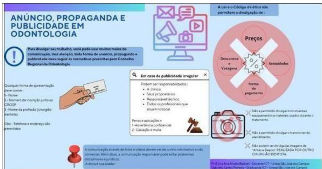
Figura 1 - Panfleto informativo disponibilizado aos participantes da pesquisa.

Ao término do preenchimento, todos os participantes receberam automaticamente um material orientativo contendo informações sobre condutas éticas, boas práticas e conformidade às normas de publicidade odontológica (Figura 1).